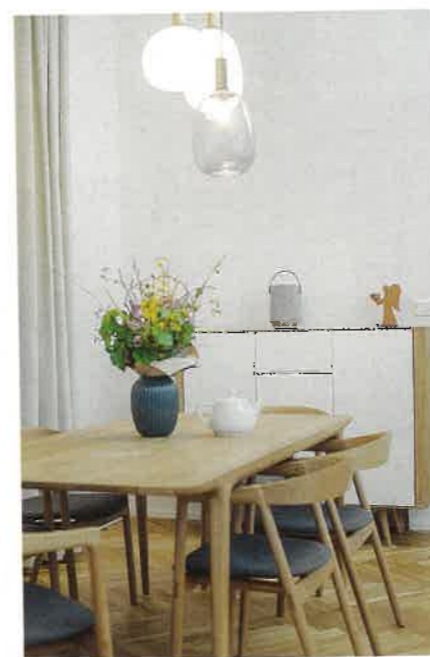
Zatímco samotný návrh proměny měla architektka hotový za 1,5 měsíce, dalšího zhruba půl roku trvala rekonstrukce a zařazení bytu.

Text: Marcela Škardová