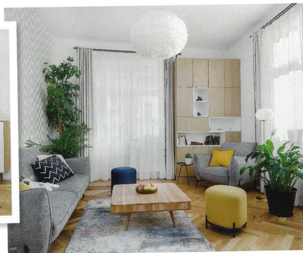
V místnostech s vysokými stropy a menším množstvím nábytku se často tvoří ozvěny, závěsy je však potlačí.

K dyž si rodina se dvěma malými dětmi pořizovala třípokojový byt